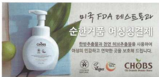
유기농화장품 전문기업 씨에이치하모니의 스테디셀러 'CHOBS 순한거품 여성청결제'. 한방추출물과 천연 허브추출물을 주성분으로 하고 있으며, 유럽화장품인증(CPNP)도 획득한 명품이다.

과 동시에 해외시장 유통에 대한 교두보가 될 것이며 향후 유럽 시장 수출을 가속화하여 글로벌 유기농 화장품 전문기업으로 성장 할 수 있도록 노력할 것"이라고 밝혔다.