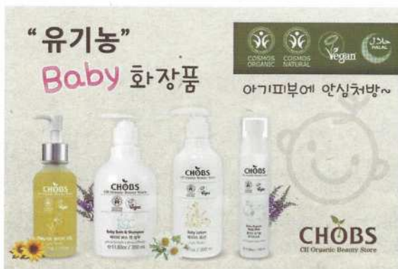
'아기피부 안심처방'을 슬로건으로 내건, 씨에이치하모니의 아기 화장품 제품 라인.